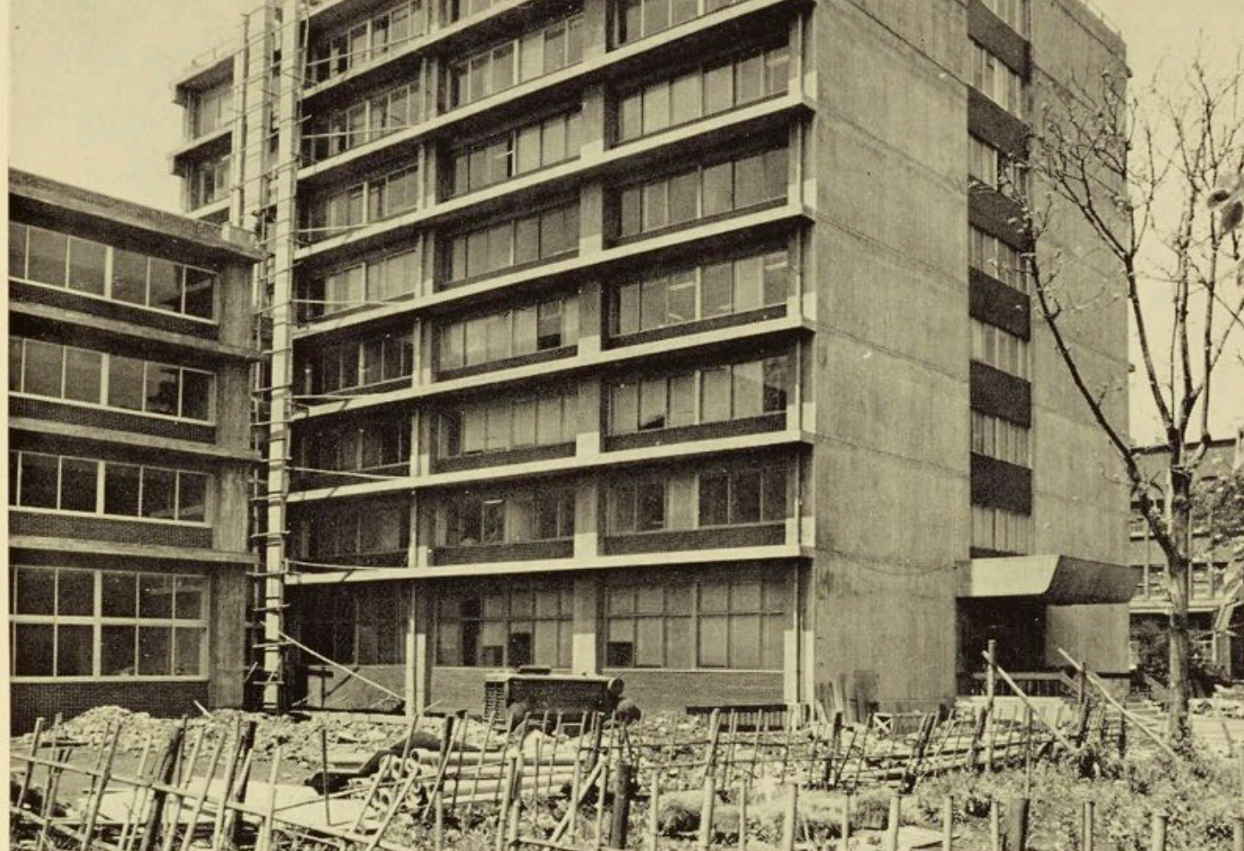
東洋文化研究所（昭和43年増築工事中）