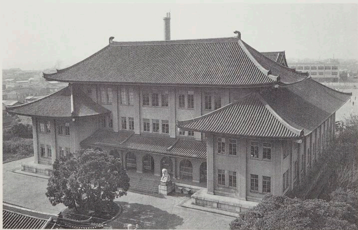
移転前の東洋文化研究所建物全景（旧東方文化学院・現外務省研修所）