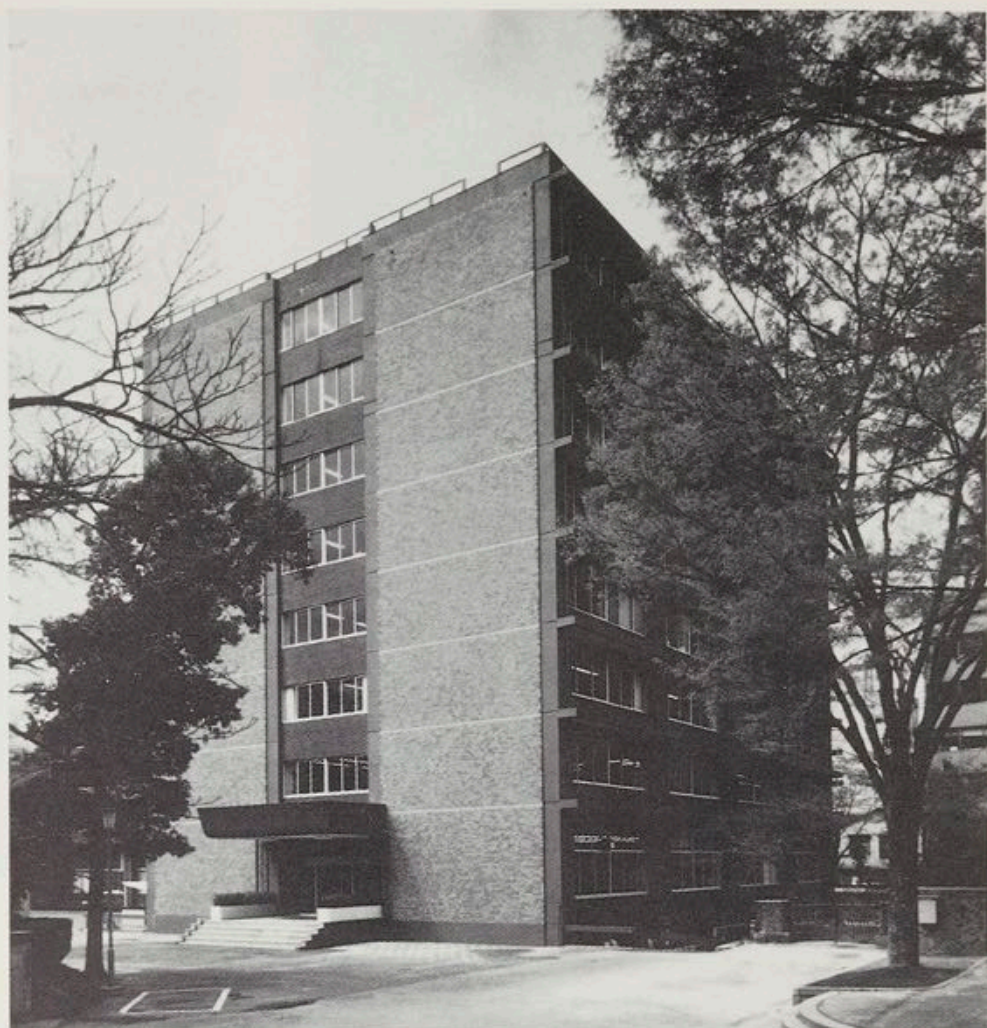
東洋文化研究所建物全景