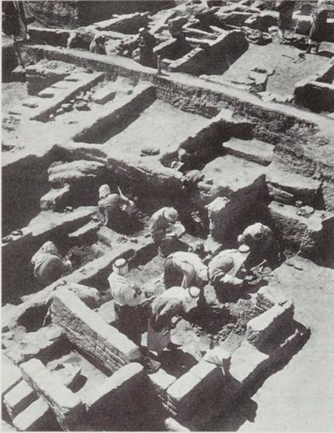
イラク、テル・サラサート第2号丘の発掘 (1956年)